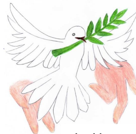
Ela Golubić, 8.a